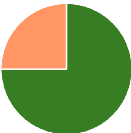
Regionaler Anteil Milch & Milchprodukte